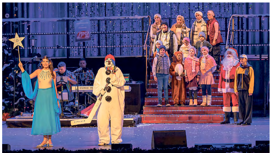
Keinerlei Alterserscheinungen: Snowy und seine Freunde toben seit 25 Jahren zur Weihnachtszeit über die Bühne des Friedrich-Wolf-Theaters Eisenhüttenstadt. Wer zu Weihnachten Freude verschenken will, wird bei den zahlreichen Veranstaltungen auf jeden Fall fündig.

i Informationen zum Theater und zu den Veranstaltungen: Stadt Eisenhüttenstadt FRIEDRICH-WOLF-THEATER, Lindenallee 23, 15890 Eisenhüttenstadt www.friedrich-wolf-theater.de Tel. 03364 7716-0