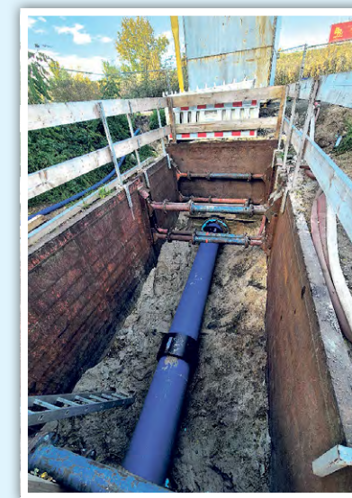
Zwischen den Schachtbauwerken wurde eine neue Rohrleitung eingesetzt.

Humeleitung. „Dagegen ist die Rohrauswechslung der 12 m DN 500 zwischen den Schachtbauwerken bzw. Knoten schon Routine.“ Zwar verlängerte sich die Bauzeit ein wenig wegen der Sonderanfertigungen der Formteile und der etappenweisen Inbetriebnahme der Teilstücke in den Schächten nach mikrobiologischer Freigabe durch die Probenahme. „Aber es lief alles ohne Komplikationen ab.“ Die Gesamtkosten für die Baumaßnahme belaufen sich auf ca. 200.000 € Brutto. „Die Versorgung unserer Kunden war zu keiner Zeit gefährdet und konnte immer gewährleistet werden. Durch die Baumaßnahme wurde die Versorgungssicherheit im Verbandsgebiet weiter erhöht.“