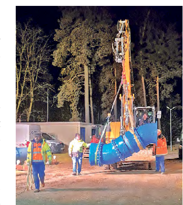
2024 investierte der TAZV etwa 2,5 Mio. Euro in die Sanierung des WW Pohlitz, für Leitungsaustauschungen, den Bau eines Schlammstapelbehälters auf der Kläranlage und die Sanierung von Pumpwerken. Aufgrund der positiven Ergebnisse kann man den neuen Herausforderungen im Wirtschaftsjahr 2026 optimistisch entgegenreten.

Auf der letzten Verbandsversammlung am 20. Oktober 2025 wurde der Jahresabschluss des TAZV Oderaue einstimmig festgestellt und der Verbandsvorsteherin Entlastung erteilt. Die Betriebszweige Trinkwasserversorgung, Abwasserbehandlung und Industriegebiet beenden das Wirtschaftsjahr 2024 mit einem positiven Jahresergebnis in Höhe von 1,7 Mio. Euro. Die Gewinne werden zur Erhöhung des Eigenkapitals bzw. zur Verlustminderung verwendet. 2024 wurden in die Anlagen und Netze des TAZV insgesamt 4,4 Mio. Euro investiert,