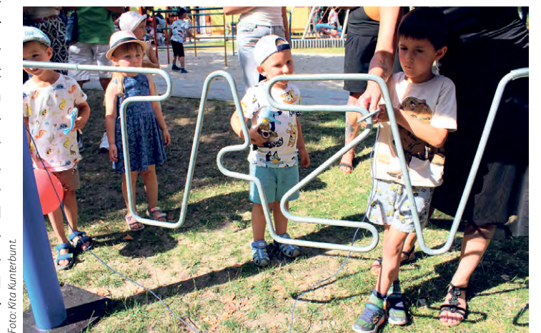
Die Jüngsten beweisen ruhige Hand und Geduld und absolvieren beim Sommer-Forscherfest das Geschicklichkeitsspiel „Heißer Draht“ des TAZV. Nur ein Beispiel für die gelebte Kooperation zwischen Kita und Verband.

unterstützt werden. Das TAZV-Team steht der Kita Kunterbunt aber auch tatkräftig zur Seite und hat im Sommer bei der Stabilisierung der Halterung eines großen Sonnenschirms geholfen. Außerdem haben die Wasserwirtschaftler beim Sommer-Forscherfest zum Thema „Mit Energie in die Zukunft“ für Spielspaß gesorgt. Sie stellten das Geschicklichkeitsspiel „Heißer Draht“ und andere Materialien zur Verfügung.