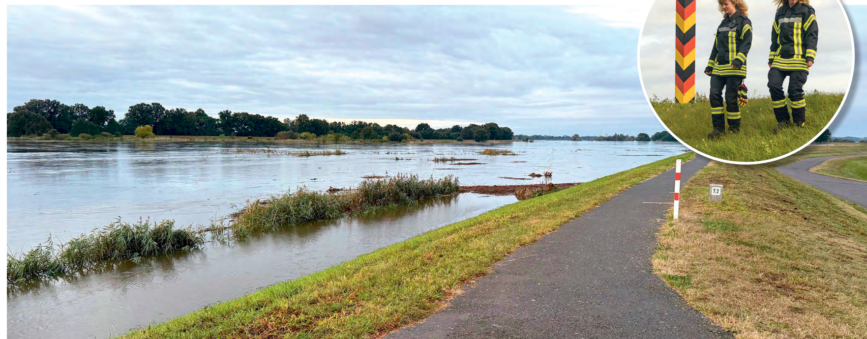
Im September 2024 erreichte die Oder fast die Deichkrone. Tagelang checkten die Schwestern die Schutzanlage auf mögliche Schäden, um den Deich zu sichern. Er hat gehalten.