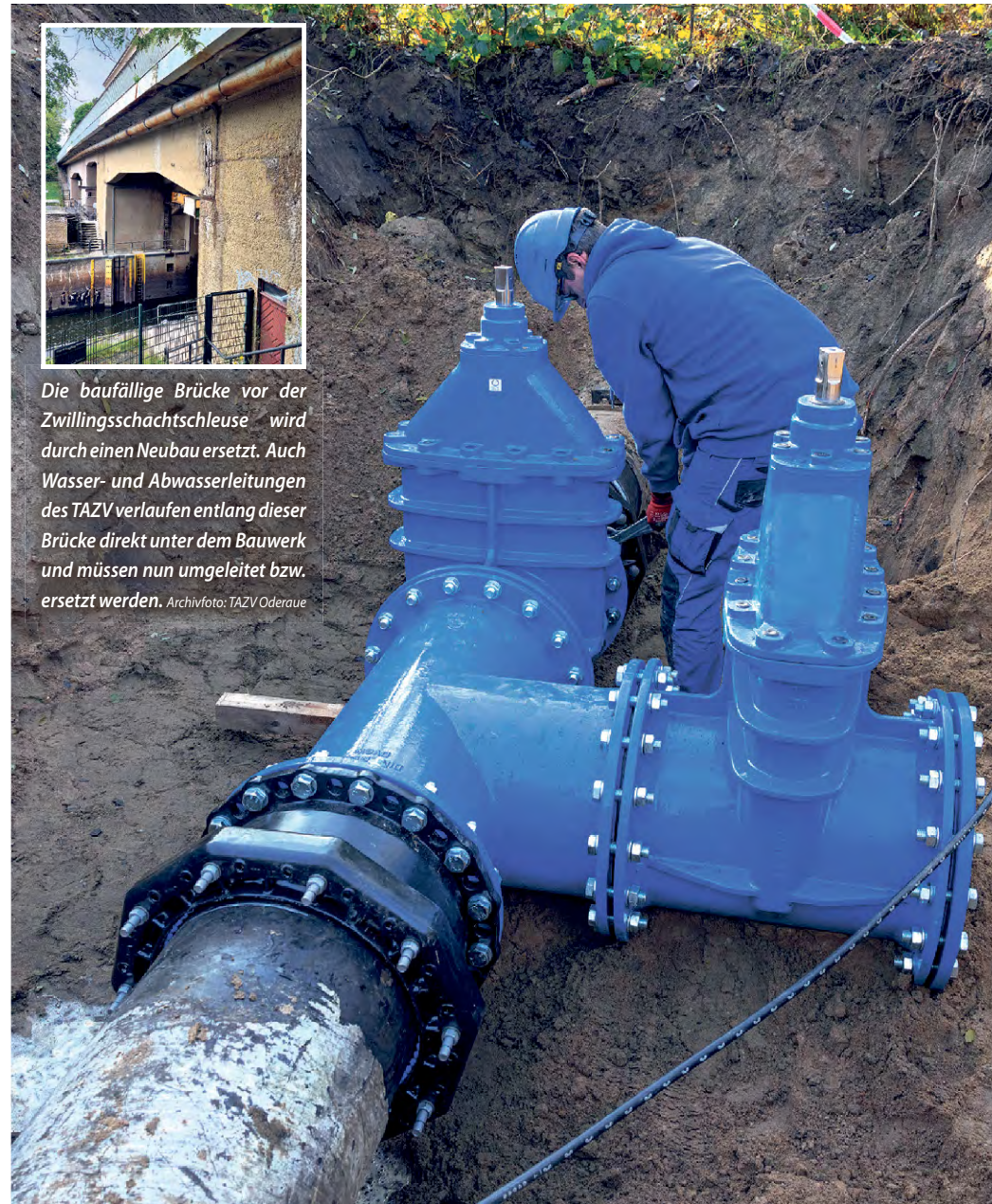
Die baufällige Brücke vor der Zwillingsschachtschleuse wird durch einen Neubau ersetzt. Auch Wasser- und Abwasserleitungen des TAZV verlaufen entlang dieser Brücke direkt unter dem Bauwerk und müssen nun umgeleitet bzw. ersetzt werden.

Im kommenden Jahr soll die Baumaßnahme zur Erneuerung der Brücke vor der Zwillingsschachtschleuse beginnen. Seit August 2023 ist sie aufgrund von Bauschäden für den Fahrzeugverkehr gesperrt. Es besteht Einsturzgefahr. Bevor es richtig losgehen kann, muss erst einmal eine Behelfsbrücke für Fußgänger und vor allem für etliche Medien für die gesamte Bauzeit errichtet werden. Auch der TAZV hat zwei Leitungen an und in der Brücke.